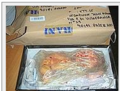
Il pacco spedito alle redazioni siciliane

Forza Nuova spedisce pacchi choc ai media: «Basta con l'aborto». Denunciati i due autori del gesto